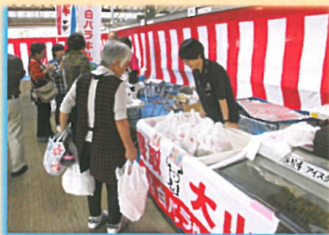
地産地消ブースでの対面販売