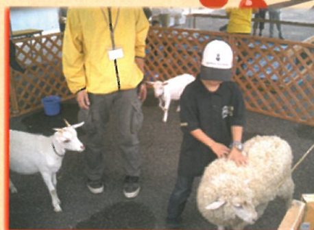
ミニ動物園でのふれあい体験